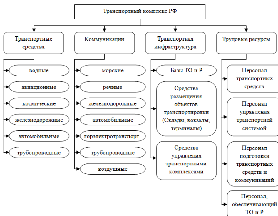
Рисунок 1 – Проблемы рационального управления развитием транспортной отрасли